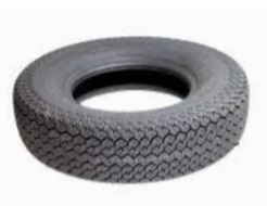
Réponse : fabriqué par les hommes