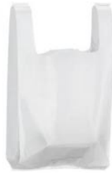
Réponse : à partir de pétrole