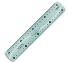
Réponse : à partir de pétrole