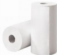
Réponse : fabriqué par les hommes