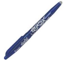
Réponse : à partir de pétrole