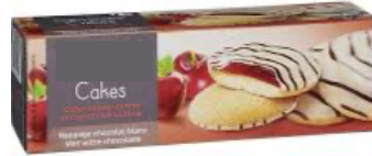
Réponse : fabriqué par les hommes