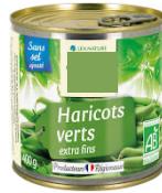
Réponse : fabriqué par les hommes