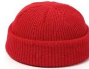
Réponse : à partir de laine