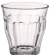
Réponse : à partir de sable