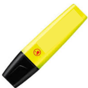
Réponse : à partir de pétrole