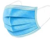
Réponse : fabriqué par les hommes