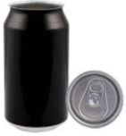
Réponse : fabriqué par les hommes