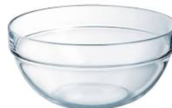
Réponse : à partir de sable