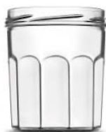
Réponse : à partir de sable