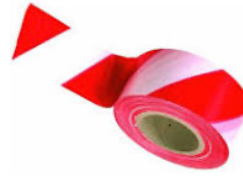
Réponse : à partir de pétrole