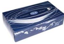
Réponse : fabriqué par les hommes