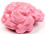
Réponse : fabriqué par les hommes