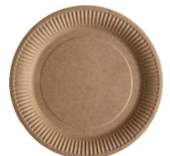
Réponse : à partir de bois