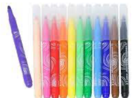
Réponse : fabriqué par les hommes