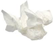
Réponse : fabriqué par les hommes