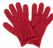
Réponse : à partir de laine