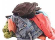
Réponse : fabriqué par les hommes