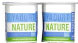
Réponse : fabriqué par les hommes